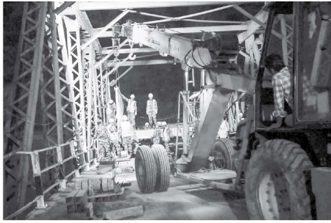
बेलिब्रिज जडानमा सेना: सिन्धुतीको खुर्कोट र रामेछापको मन्थली जोड्ने पक्की पुलको आधा भाग सुनकोशी नदीमा आएको बाढीले काण्डपछात पुनर्निर्माणमा खटिरहेको नेपाली सेनाको टोलीद्वारा जडान गरिएको बेलिब्रिज। यो कार्य सम्पन्नसँगै मंगलबारबाट यातायात सुचारु भएको छ।