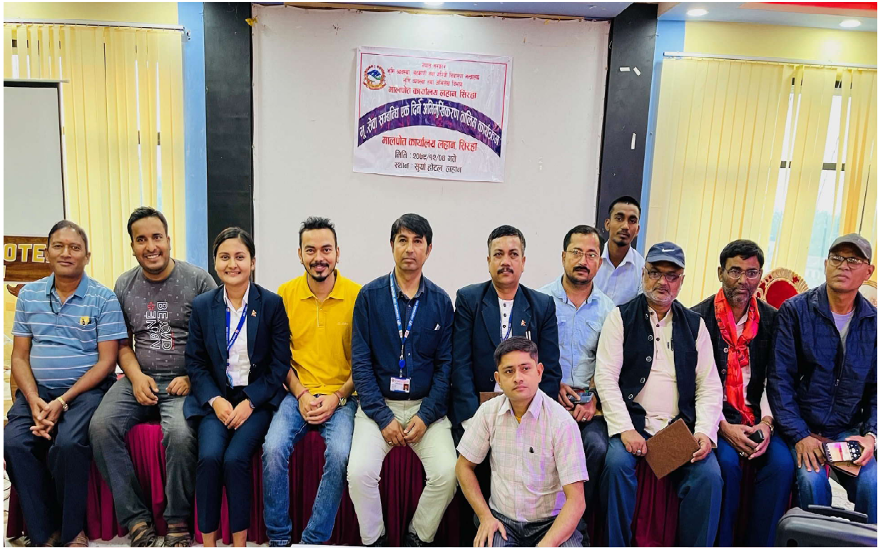
भूमि व्यवस्थापन तथा अभिलेख विभागको सरहरूबाट अनुगमन तथा निरीक्षण